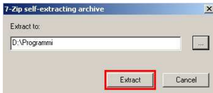
Figura 3: Estrazione e creazione Cartella "Prezzario Regione Piemonte 2011 CD"

4. Per procedere con l'installazione cliccare sul pulsante "Extract" (Fig. 3).