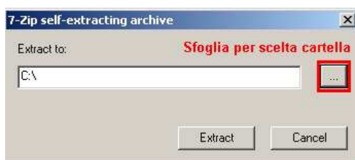
Figura 1: Scelta cartella di destinazione